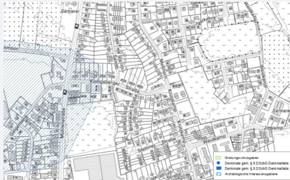
Abb. Auszug aus der Archäologischen Landesaufnahme

Die Belange des archäologischen Denkmalschutzes werden in der Begründung der 6. Änderung des Flächennutzungsplanes und in der Begründung des Bebauungsplanes Nr. 78 der Stadt Barmstedt ausreichend berücksichtigt. Daher haben wir keine Bedenken und stimmen den vorliegenden Planunterlagen zu.